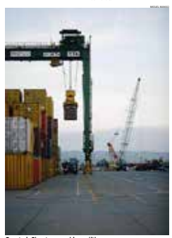
O Porto de Sines tem crescido nos últimos anos

"Por resposta incluída da parte da APS, mas da parte marítima não houve até agora nenhuma desmotivação", disse. O que estava previsto é que esse negócio fosse tratado pela empresa civil, a civilidade da construção civil, e o comércio químico, ao redireccionar a actividade para a exportação, tem sido o principal cliente. A taxa de crescimento prevista para este ano é de 15%, chegando-se até 100 mil toneladas. Com os obras dos últimos anos, a actividade e a capacidade comercial.