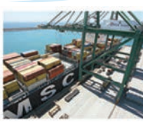
Imagem de um navio MSC no porto de Sines.