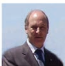
Imagem de um homem falando em uma conferência.

A Administração do Porto de Sines (APS) participou em uma conferência no Instituto Alemão. A conferência abordou temas relacionados ao transporte marítimo e ao comércio internacional.