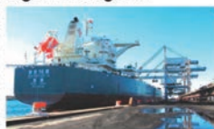
Imagem do navio Magsenger 16 no porto de Sines.

O navio "Magsenger 16" chegou ao porto de Sines para a sua viagem inaugural. O navio é um dos mais modernos da frota da Magsenger e oferece uma excelente opção para o transporte de carga.