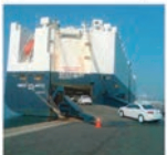
Imagem de um navio no porto de Sines.

A Autoeuropa escolheu o porto de Sines para a sua operação de transporte de camiões. A escolha foi feita após uma visita técnica ao porto, realizada em outubro. O porto de Sines foi considerado o mais adequado para a operação, devido à sua localização estratégica e à capacidade de receber grandes navios.